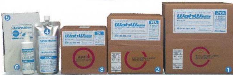
エコリーフ対象製品